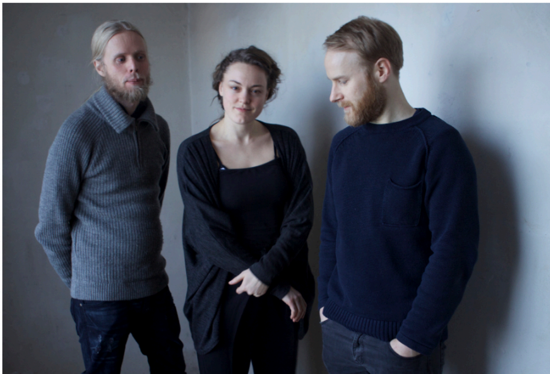
Building Instrument